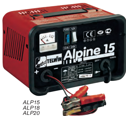
ALP15 ALP18 ALP20