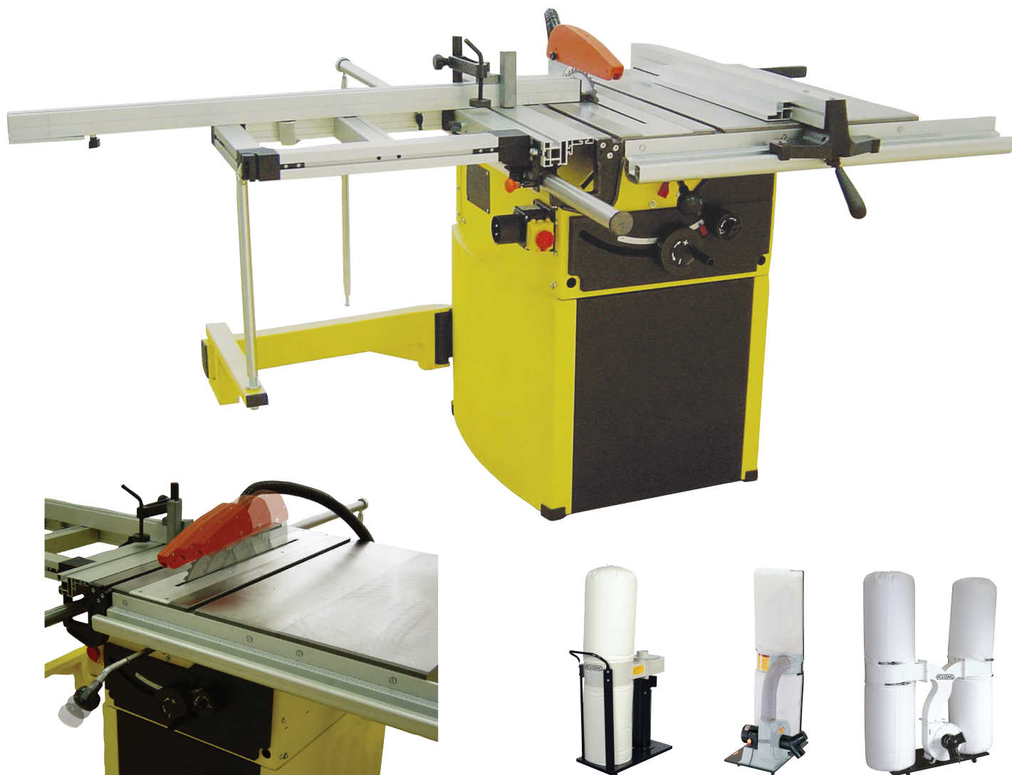
Avance transversale de la lame par action sur la manette