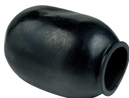
849030 Vessie 24 L