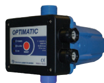
849041 Autoclave électronique Optimatic