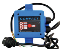
849046 Autoclave électronique Compact 2