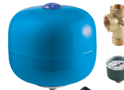
849025 Cuve verticale 24 L avec kit