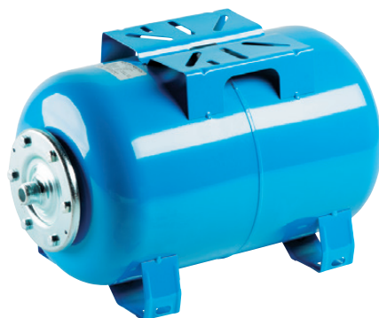
849000 Cuve horizontale 24 L