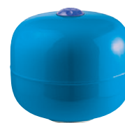
849010 Cuve verticale 24 L