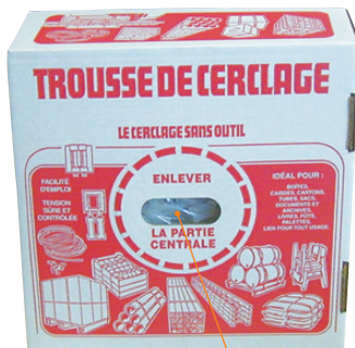
Boîte de distribution