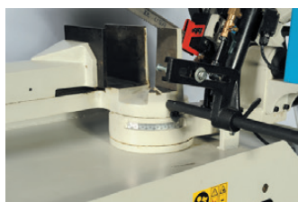
Rotation de l'archet