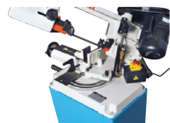
Position 1 de l'étau : coupe 45° droite.