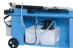
Système d'arrosage dans le socle.

Tendeur de lame et arrosage en direct sur la lame avec arrêt en fin de coupe.