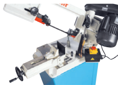
Position 2 de l'étau : coupe 45° et 60° gauche.