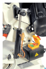
Réglage de la vitesse de descente de l'archet par vérin.