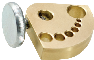
Bloc guidage électrode