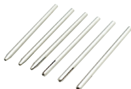
Guides pour électrode courte