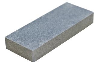
Pierre de nettoyage