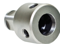
Adaptateur pour trépan serrage par "BTR"