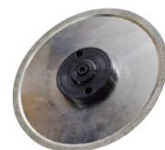
Meule d'affûtage CBN