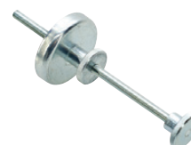
Butée magnétique réglable pour fraise