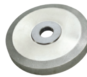
Meule 125mm faces larges