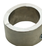
Guide pour trou oblong