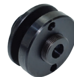
Adaptation tout type meule