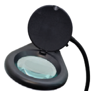
Loupe avec éclairage