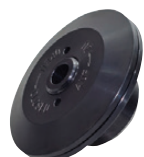
Dispositif fixation disque diamant