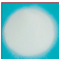
Microbille en verre