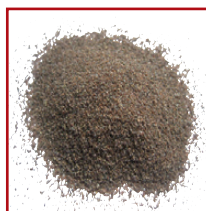
Silicate de calcium