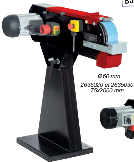
Ø 60 mm 2635020 et 2635030 75x2000 mm