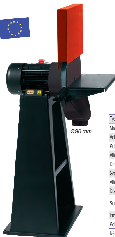
Ø 90 mm