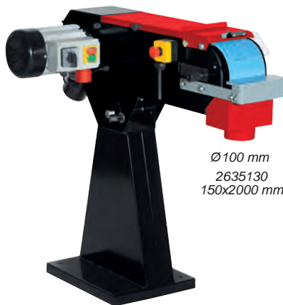
Ø 100 mm 2635130 150x2000 mm