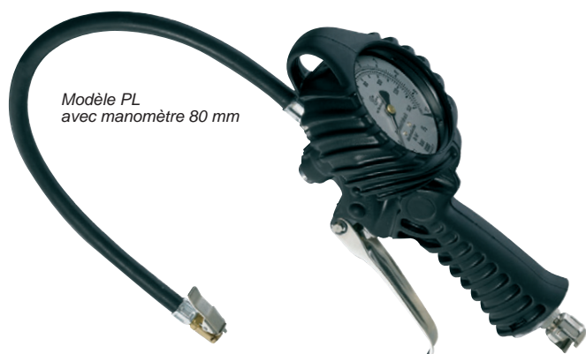
Modèle PL avec manomètre 80 mm