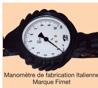
Manomètre de fabrication Italienne Marque Fimet